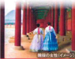
韓服の女性(イメージ)