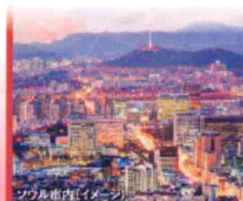
ソウル市内(イメージ)