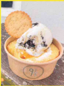
ぎゅうとごぶんのいち